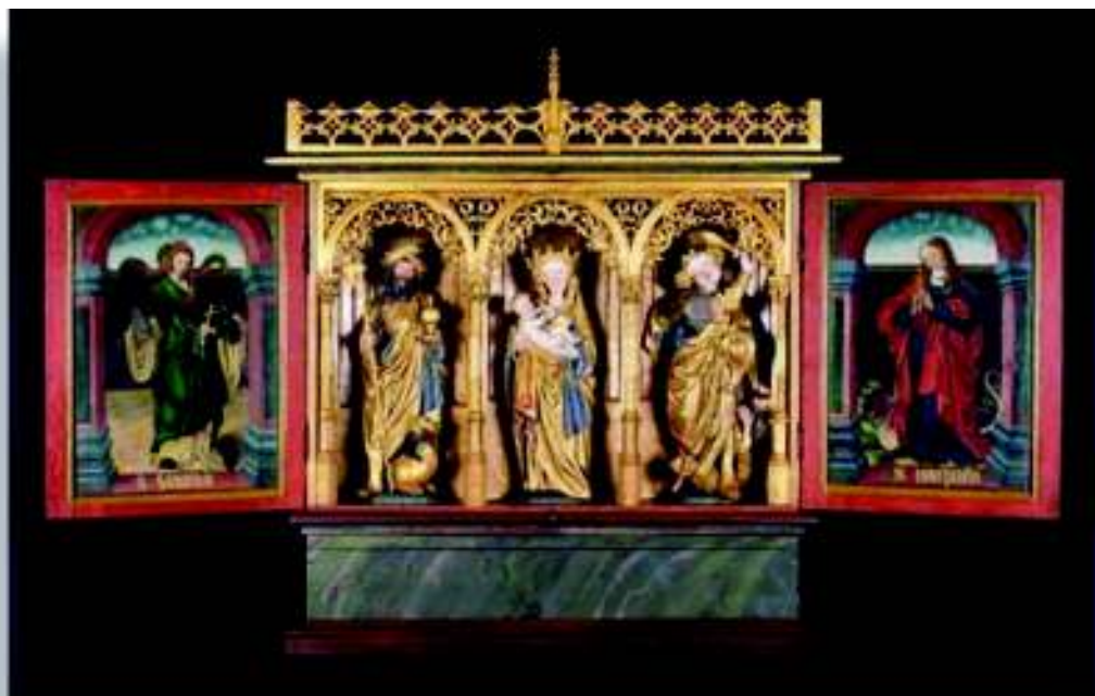
Leka kirkes alterskap

I tillegg fins bl.a. fem 1700-talls temperamalerier. Både alterskapet og temperamaleriene ble reddet ut da den gamle kirken ble rammet av lynnedslag og brant ned i 1864.